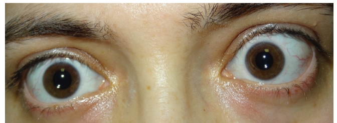
Resim 2: Sol göze uygulanan ameliyattan bir hafta sonra, pupillaların izokorik görünümü.

Hastanın düşük düzeyde fotofobi dışında şikayeti yoktu. Hastanın anizokorisi aydınlık ve karanlık ortamlarda farklılık göstermiyordu (aydınlıkta ve karanlıkta horizontal pupil çapları sırasıyla sağ gözde 3 mm ve 5 mm, sol gözde 5 mm ve 7 mm) ve anizokori için etiyolojik bir neden bulunamadı. Hastanın her iki gözdeki ışık refleksi doğaldı, göz hareketleri tüm yönlerde serbest olup, proptosis, ptosis veya pupillalarda ışık-yakın disosiasyonu izlenmedi. İlk ameliyattan yaklaşık 1 ay sonra sol göze şeffaf lens ekstraksiyonu ve katlanabilir göz içi lens implantasyonu yapıldı.