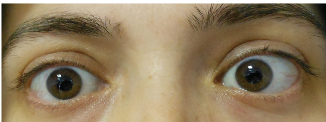
Resim 3: Sol göze uygulanan ameliyattan üç ay sonra, pupillaların izokorik görünümü.

Anizokori, iki pupillanın çaplarının eşit olmaması olup, genellikle eferent bir pupilla bozukluğunu gösterir. İki göz arasında 0.5 mm'den fazla fark olması önem arz eder.