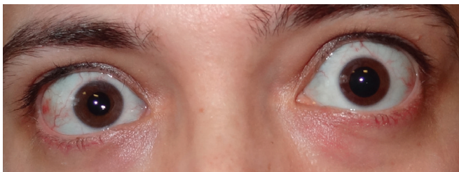
Resim 1: Sağ göze uygulanan ameliyattan bir hafta sonra, pupillaların anizokorik görünümü.

Pupil çapı dilatatör ve sfinkter pupilla kasları arasındaki dengeye bağlı olarak değişebilir. Pupil çapını temel olarak ortamdaki ışık şiddeti etkiler. Bunun yanı sıra yaş, duygusal durum ve göz içi basıncı gibi faktörler de pupil çapını etkileyebilir. 7 Burada, bilateral dejeneratif miyopisi olan olguya uygulanan şeffaf lens ekstraksiyonu ve katlanabilir IOL implantasyonu ameliyatı sonrası görme keskinliği artan, ilk ameliyat sonrası anizokori gelişen ve diğer göze uygulanan ameliyattan sonra anizokorisi düzelen bir olgu sunulmaktadır.