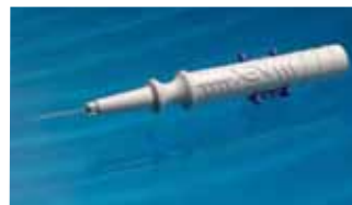
Resim 10: Xen enjektör sistemi.