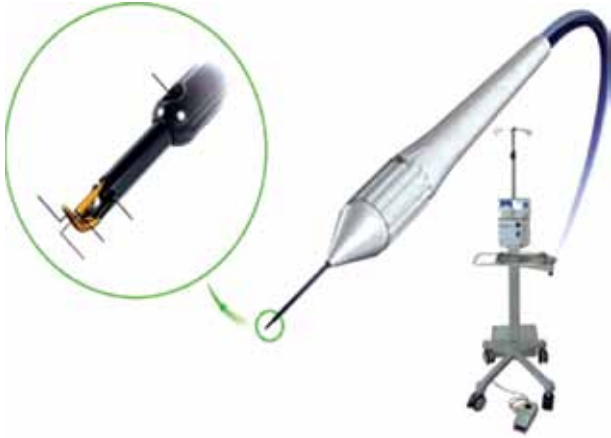
Resim 7: Trabectom cihazı.

%77.6 oranında ameliyat sırasında kan reflüsü görülürken, bu durum GİB yüksekliği ile korelasyon göstermeyip, sıklıkla birkaç gün içerisinde gerilemiştir. Bir diğer önemli komplikasyon ise geçici GİB yüksekliği olmuştur (n=65, %5.8). Bu işlemin başarısız olduğu olgulardan 67'sine takip eden dönemde trabekülektomi, 18'ine ise şant ameliyatı gerekmiştir. 42 Maeda ve ark., 43 Japon hasta popülasyonunda 80 gözü kapsayan trabektom serilerinde 6. ayda GİB'nda %28.7 oranında düşüş kaydedilmiştir. Tüm olgularda kan reflüsü görülürken, 13 olguda ek cerrahi girişim ihtiyacı olmuştur. Francis ve ark., 44 glokom ve katarakt birlikteliği nedeniyle trabektom+fako uyguladıkları 304 olguyu değerlendirdikleri çalışmalarında GİB düşüşü ve kullanılan İS'nda azalma rapor etmişlerdir. Ameliyat öncesi İS ortalaması 2.65 \pm 1.13 olan olguların İS ortalaması 6. ayda 1.76 \pm 1.25 'e, 12. ayda ise 1.44 \pm 1.29 'a gerilemiştir. Bu çalışmada da sıklıkla kan reflüsü görülmüş olup (%78.4), kısa sürede gerilemiştir. Dokuz olguda takip eden dönemde ek glokom cerrahisi gereksinimi olmuştur.