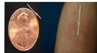
Resim 11: Innfocus.