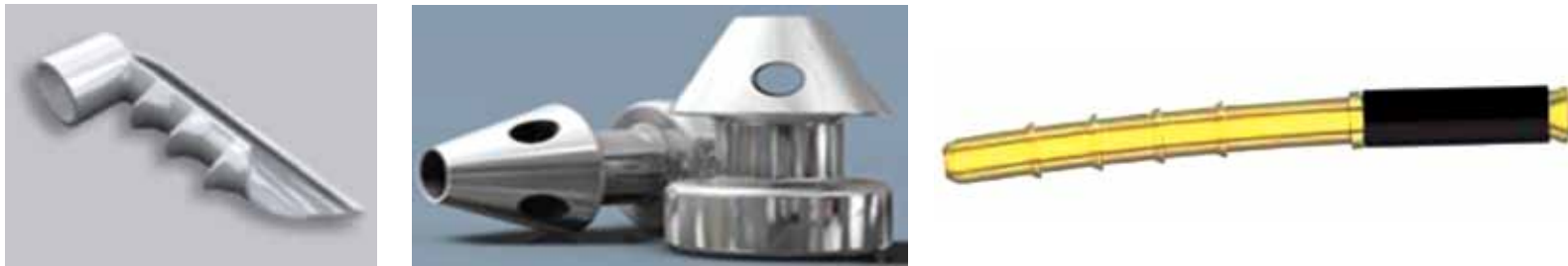
Resim 4-6: iStent, iStent injekt ve iStent supra

trabeküler akım kolaylığı üzerindeki etkisini inceleyen çalışmalarında, istatistiksel olarak anlamlı artış tespit ettiklerini bildirmişlerdir. 38 Voskanyan ve ark., 39 çok merkezli çalışmalarında 99 AAG'lu olguya 2 adet iStent injekt implantasyonu yapılarak 12 aylık izlem yapılmıştır. Çalışma sonunda etkili GİB düşüşü yanında kullanılan İS'nda anlamlı azalma bildirilmişlerdir. Fea ve ark., 40 raporlarında ise iki adet antiglokom ilaç kullanımına (1. grup) karşı 2 iStent injekt implantasyonunun (2. grup) etkinliği karşılaştırılmıştır. Ortalama GİB azalması ilk grupta 7.2 \pm 2.2 mmHg iken, 2. grupta 8.1 \pm 2.6 mmHg olarak hesaplanmıştır. İmplantın en az ilaç kullanımı kadar etkili ve güvenli olduğu sonucuna varılmıştır.