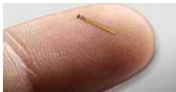
Resim 9: CyPass.