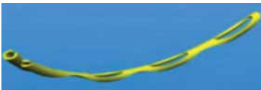
Resim 8: Hydrus.

Hipotoni başta olmak üzere görmeyi tehdit eden ciddi komplikasyonların azlığı MİGC tekniklerini uygulama konusunda hekimleri cesaretlendirebilir. Özellikle implant bazlı cerrahiler dikkate alındığında kolay öğrenilebilir ve uygulanabilir olmaları da, adaptasyonu kolaylaştırıcaktır. Ancak ekonomik koşullar dikkate alındığında bu yeni cihazların maliyetleri göz ardı edilemez. Bununla birlikte filtran cerrahilerde ameliyat sonrası ziyaret sayısı ve/veya ek girişimlerin getireceği mali yük de hesaba katılmalıdır.