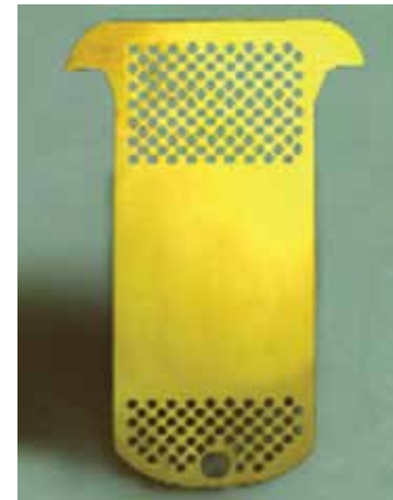
Resim 3: Gold mikroşant (SOLX).

Kanaloplastide son zamanlarda geliştirilen bir diğer yöntem, ab interno kanaloplasti uygulamasıdır (ABİC). Bu uygulamada fako sonrası side portdan ön kamaraya girilerek gonyoskopik görünüm altında trabeküler ağda 1 mm genişliğinde küçük bir horizontal diseksiyon yapılır. Daha sonra iTrack kanal içerisinde mikro aydınlatma sisteminin de yardımıyla dikkatli bir şekilde ilerletilir. Tüm kanalın 360° kanülasyonunun ardından, mikrokater gözden çekilirken ab externo uygulamaya benzer olarak viskoelastik madde enjeksiyonu gerçekleştirilir. Amaç, bir yandan kanalı dilate etmek, diğer yandan da trabeküler ağ iç duvarının kolektör kanallardan uzaklaşmasını (olası herniasyonun çözülmesini) sağlamaktır. Uygulamanın önemli bir avantajı da, ileride gerekebilecek diğer cerrahi uygulamalar için konjunktivanın sağlam bırakılmasıdır. 6